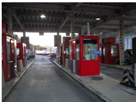
E T Cシステム設置工事 施工箇所

また、次年度以降に実施を計画する、トンネル照明のナトリウムランプからL E Dへの更新工事に先立ち、トンネル照明詳細設計を実施します。