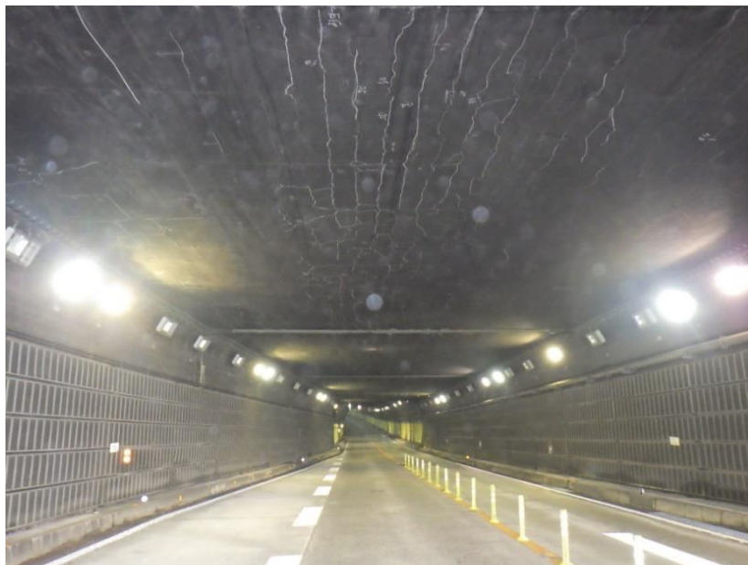
道路災害防除工事 施工箇所 (真鶴トンネル)

また、2022（令和4）年3月21日から神奈川県管理となった、県道28号（本町山中）及び県道26号（横須賀三崎）の道路パトロール業務委託を今年度から新たに受託します。