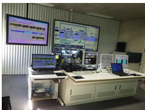
監視制御設備更新等工事 施工箇所

また、新島トンネル照明設備更新工事により照明灯のLED化を実施し、SDGsの取り組みとして環境への負荷を低減する維持管理の推進を図ります。