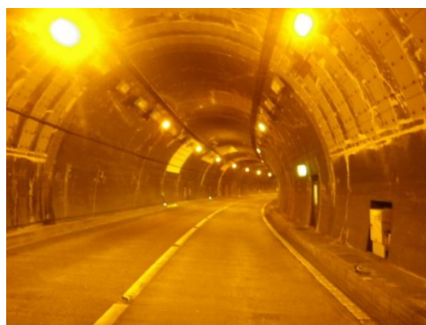
LED照明設備更新工事 施工箇所