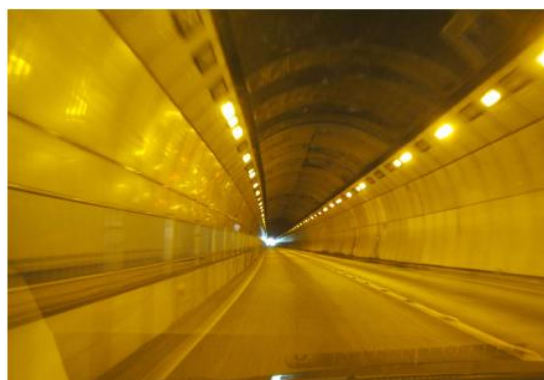
L E D照明設備更新工事 施工箇所