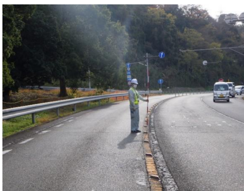
排水性舗装補修工事 施工箇所

また、逗葉トンネル照明設備更新工事により照明灯のL E D化を実施し、S D G sの取組みとして環境への負荷を低減する維持管理の推進を図ります。