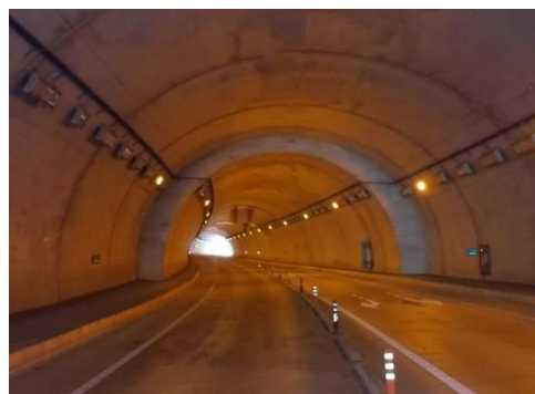
L E D照明詳細設計 施工箇所