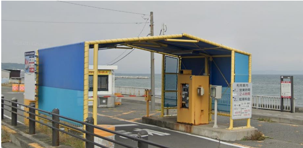
E T C機器設置工事 施工箇所 (駐車場出口)