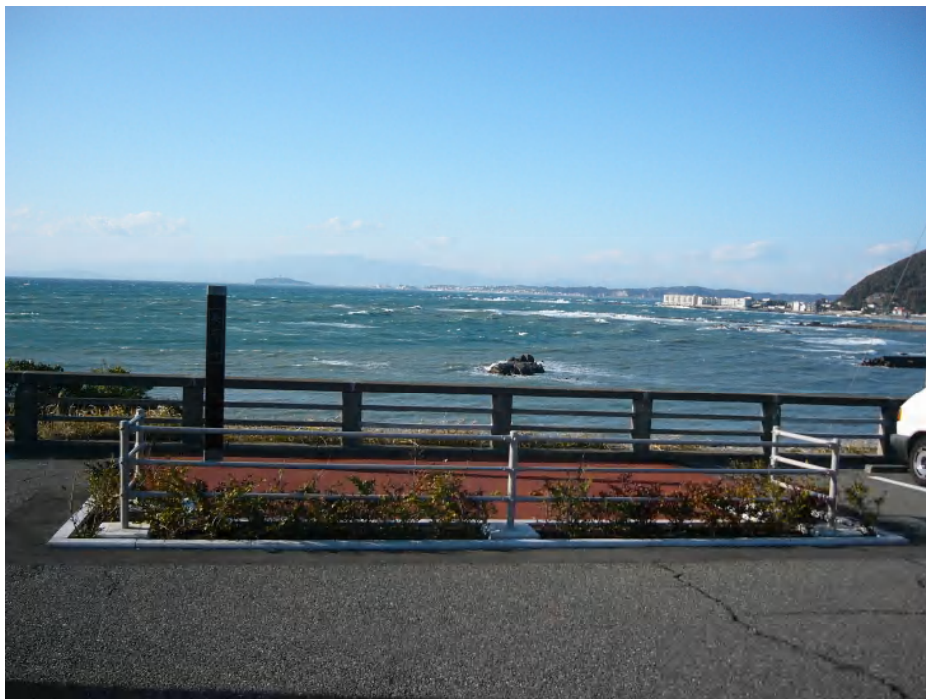
“とるば”撮影スポット（電線地中化工事後）

新たな営業方針の下での町有地駐車場の供用及び平日無料開放は、平成22年3～4月に駐車場の路面整備、出入口改良工事等を行った上で、平成22年5月1日に開始する予定。